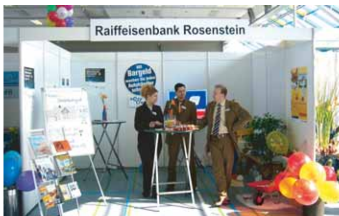
Immer wieder beteiligt sich die Bank bei örtlichen Messen und Veranstaltungen der Gewerbe- und Handelsvereine.