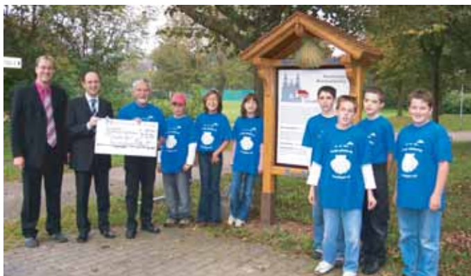
Die Bank unterstützt regelmäßig gemeinnützige Institutionen. Darüber freuten sich zum Beispiel die Heuchlinger zur Neugestaltung des Jakobuswegs sowie die Römerköche Böbingen.