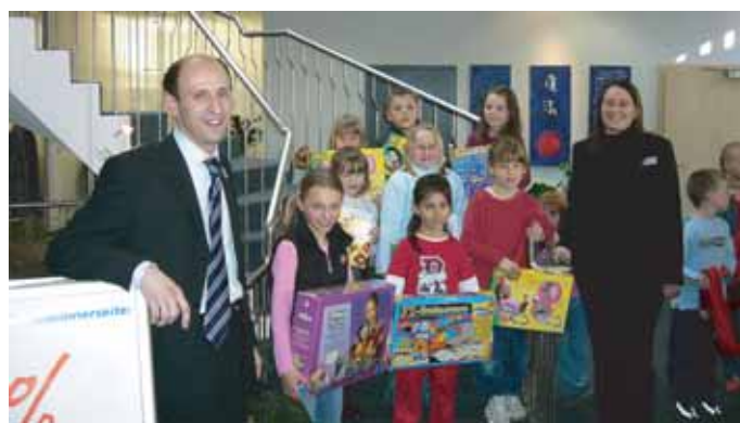
Beim alljährlichen Malwettbewerb kommen kleine Künstler ganz groß raus und freuen sich über ihre Gewinne.