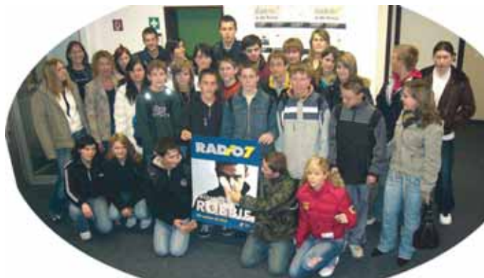
Die Klasse 9 der Hauptschule Möggingen war begeistert von der gewonnenen Ausfahrt zu Radio 7 nach Ulm.